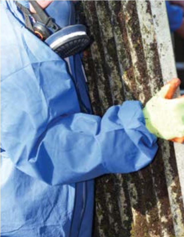
إلبس ثياباً للحماية لدى الترميم.

تنوافر الـ PPE تجارياً لدى مزوّدي قطاع البناء، متاجر معدّات السلامة وبعض متاجر الخردوات.