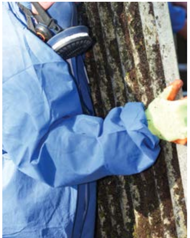
Mặc quần áo bảo hộ khi tân trang.

PPE có bán trên thị trường tại các tiệm bán vật liệu xây dựng, tiệm bán thiết bị an toàn và một số tiệm ngũ kim (hardware store).